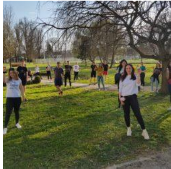
Dan planete Zemlje