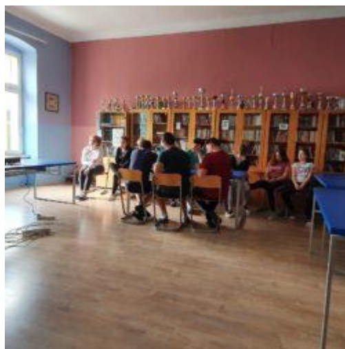
Posjet biskupa Vjekoslava Huzjaka